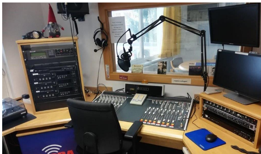
Nasvidenje stari studio ...

Od oktobra do decembra: tretja faza prenove na južnem Štajerskem, ki je vključevala nadaljnje naročanje in dobavo materialov ter obnovo tehnične (prenosne) opreme. Ostala dela so še v teku in bodo zaključena leta 2024.