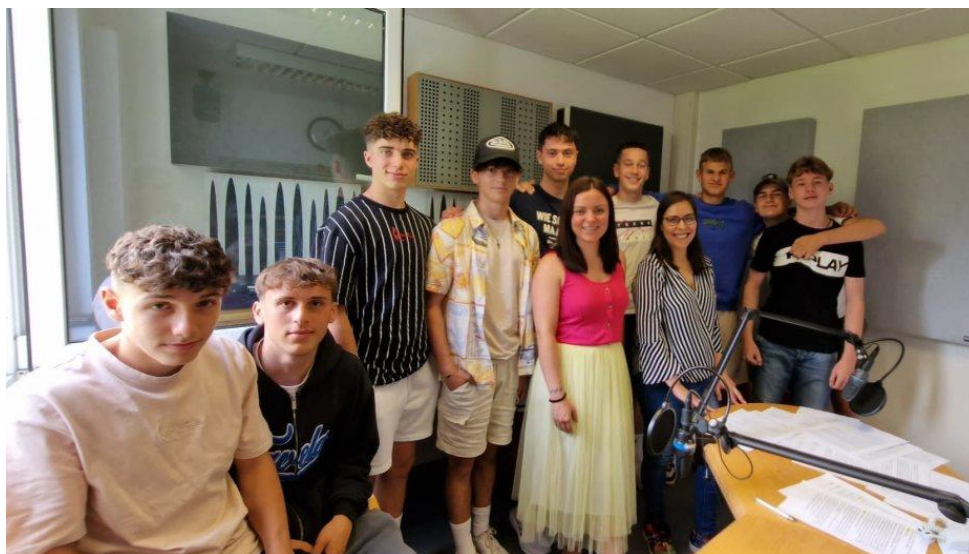
Učenci 2. GHH razreda HAK 1 International Celovec

Dan šolskega radia je leta 2023 praznoval 10. obletnico in je, kot vsako leto, potekal 29. novembra v sodelovanju z vsemi avstrijskimi neodvisnimi radijskimi postajami. Od 9. do 17. ure so te postaje predvajale enoten program, ki ga je tokrat vodil Radio FREQUENNS. Cilj usmeritve tega programa je prikazati, kako sodelovanje med šolami in neodvisnimi radijskimi postajami v praktičnih delavnicah spodbuja medijske veščine med otroki in mladimi. Na dnevu šolskega radia se delo na področju medijske vzgoje in oddaje, ki nastanejo pri tem, tudi predstavi.